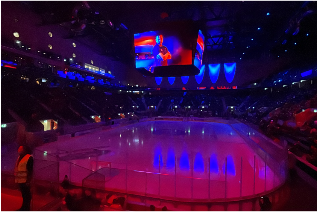
Vor dem Anpfiff die Licht - Show

Ein hin und her auf dem Spielfeld. Der ZSC und der HC Ajoie kämpften um jeden Puck, Gegner wurden angefahren und gestört, schnelle Abspiele und Spässe waren auf dem Eisfeld zu sehen. Fast das Gleiche wie beim Fussball, nur es wird auf dem Eis gespielt, die Spieler haben Schlittschuhe anstelle von Fussballschuhe und der Ball ist der Puck.