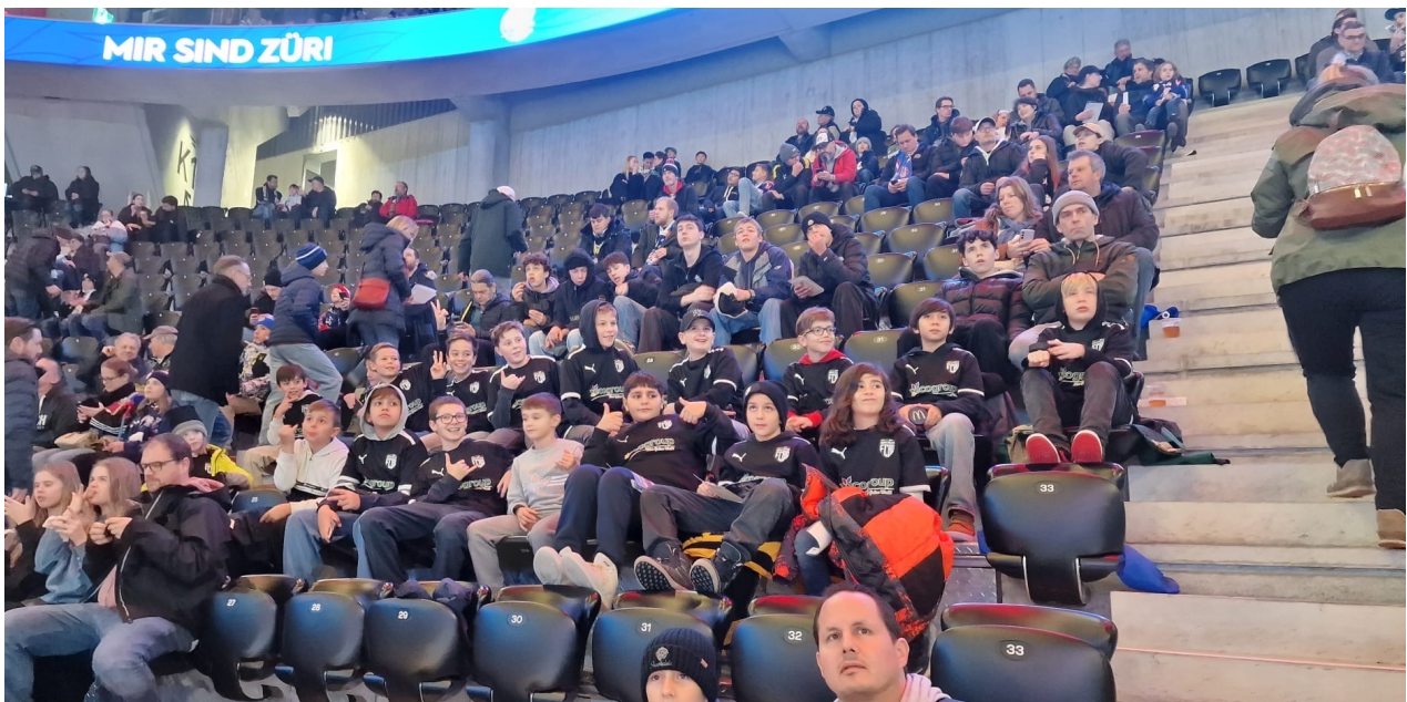
Unsere Db- Kids

Ein hin und her auf dem Spielfeld. Der ZSC und der HC Ajoie kämpften um jeden Puck, Gegner wurden angefahren und gestört, schnelle Abspiele und Spässe waren auf dem Eisfeld zu sehen. Fast das Gleiche wie beim Fussball, nur es wird auf dem Eis gespielt, die Spieler haben Schlittschuhe anstelle von Fussballschuhe und der Ball ist der Puck.