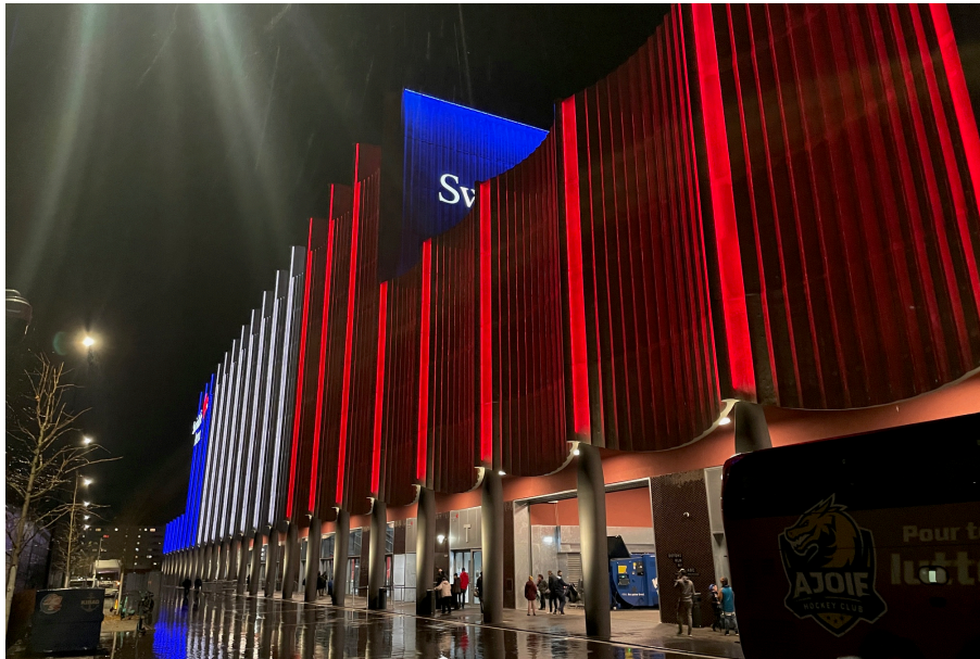
Die Swiss Life Arena