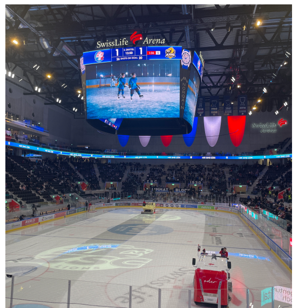
Das Zuhause vom ZSC