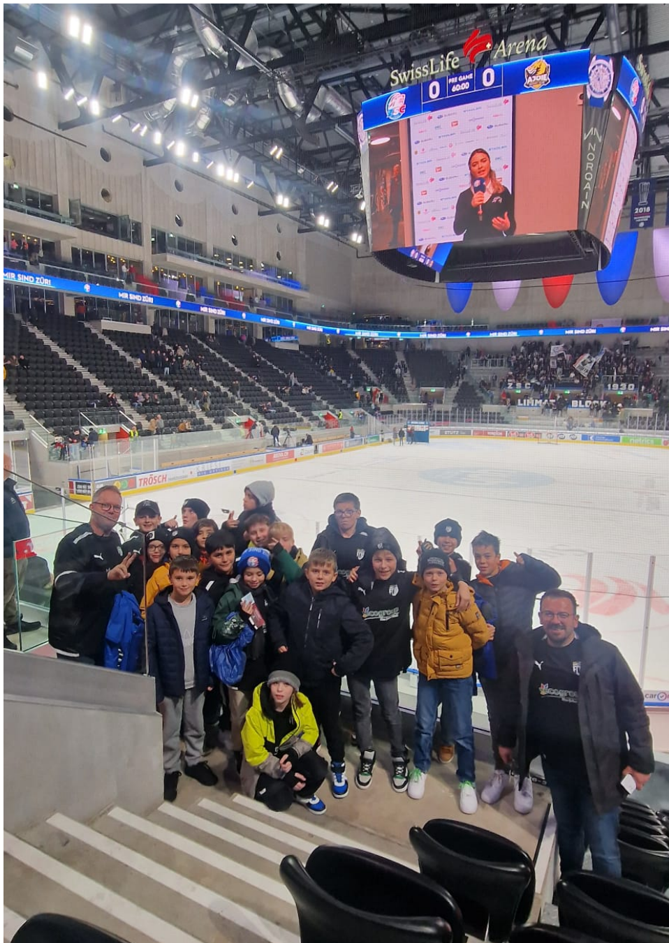
Das mega Team / Sa. 09.12.2023 Swiss Life Arena

Jungs ihr seid die grössten und die besten. Ein kompakte, homogene Mannschaft welche zusammenhält und für einander einsteht. Alle für einen, einer für Alle ist unser Motto.